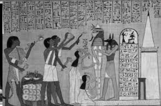
Նկ. 4. Դամբարանի պատի պատկեր