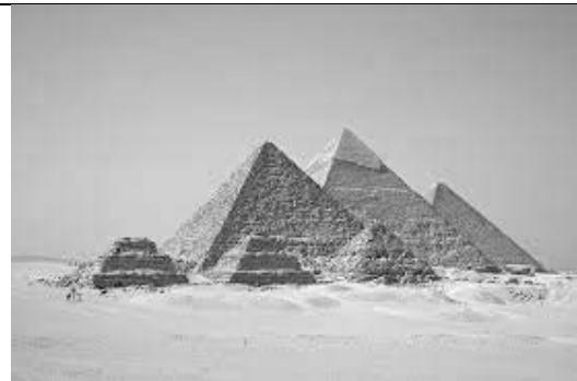
Նկ. 2 Քեոպսի բուրգը