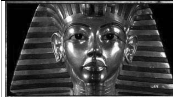
Նկ. 3 Թութանհամոնի դիմակը