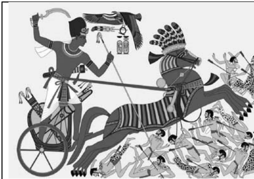
Նկ. 1 Ռազմական մարտակառք

Ստորև ներկայացված նկարներից զատ ներկայացրու նաև քո տարբերակը. . .