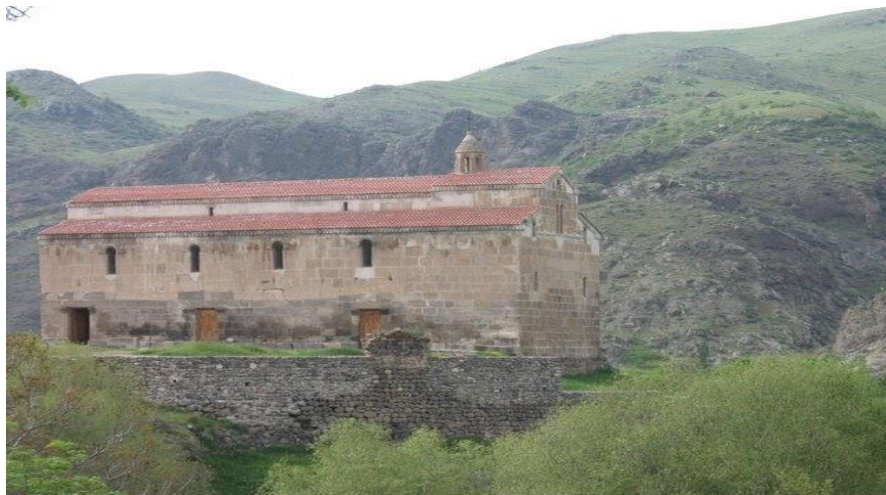
Գտնվում է Արցախի Քաշաթաղ շրջանում

6. Բնագի՛րը փոխադրիր որպես մելիքի անձնական խոստովանություն, որն արվել է մահվանից առաջ: